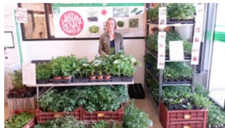
Le jardin de Nat.

14H-15H : Visite du Gaec Le jardin de Zélie à Fertans