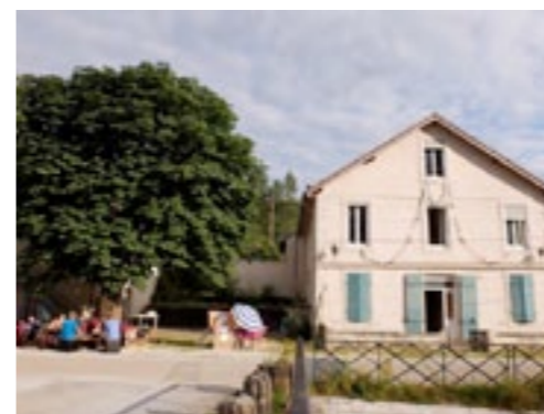
La double écluse.

17H-20H : Stand d'information de la LPO (Ligue de Protection des Oiseaux)