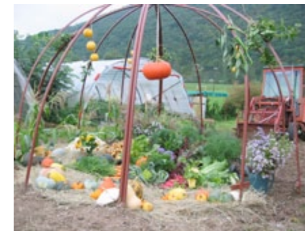
Les jardins de Cocagne.

14H-15H30 : Visite du Jardin de Nat à Besançon